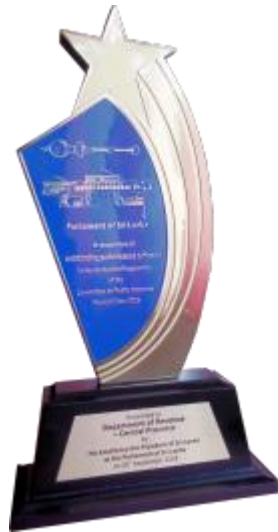
2.2 රූප සටහන රජයේ ගිණුම් පිළිබඳ කාරක සභාවෙන් ලද රන් සම්මානය

2019 වසරේදී පැවති, 2017 ගිණුම් වර්ෂයට අදාළ රාජ්‍ය ආයතනවල මූල්‍ය කළමනාකරණය සහ කාර්යය සාධනය පිළිබඳව රජයේ ගිණුම් පිළිබඳ කාරක සභාව මගින් සිදුකරනු ලැබූ ඇගයීම් ක්‍රියාවලියේ දී ද පෙර වසරේදී මෙන් මධ්‍යම පළාත් ආදායම් දෙපාර්තමේන්තුව රන් සම්මානයෙන් පුදනු ලැබීය.